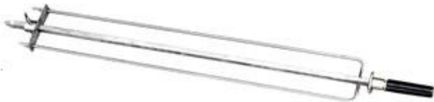
Spiedo doppio in Acciaio Inox