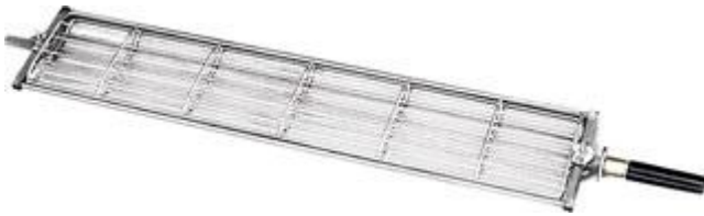
Spiedo a gabbia in Acciaio Inox