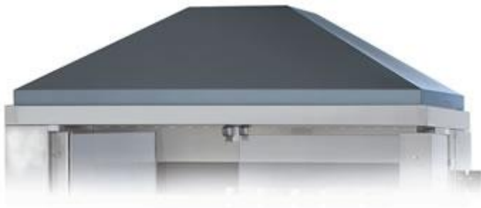
Cappa senza filtri da appoggio sul girarrosto Dim. mm 1065x450x300h