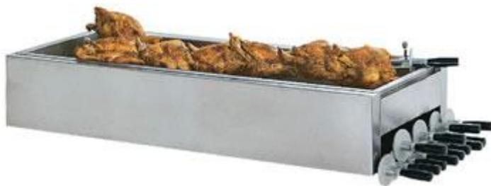
Porta spade in Acciaio Inox dim. mm 1098x480x400h