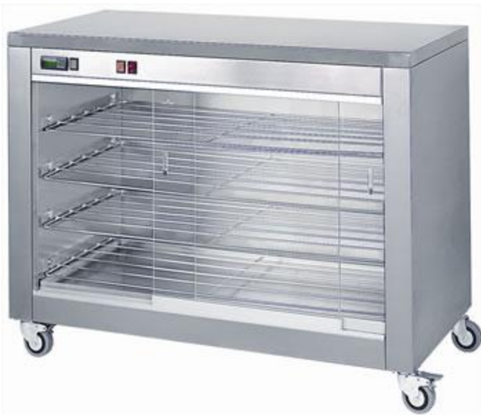
Supporto in Acciaio Inox caldo/secco con vetri scorrevoli Dim. mm 1190x480x840h Alimentazione: 230 V Potenza assorbita: 2,0 KW Peso: 73 Kg