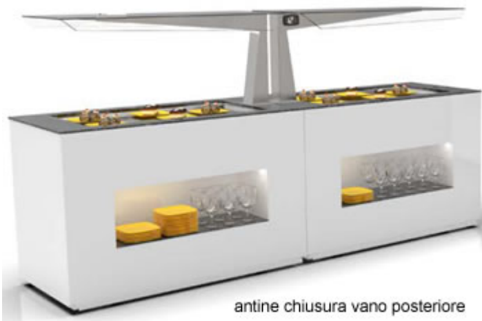
antine chiusura vano posteriore