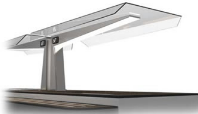
potente sistema di illuminazione 500 k integrato nell'ala protettiva